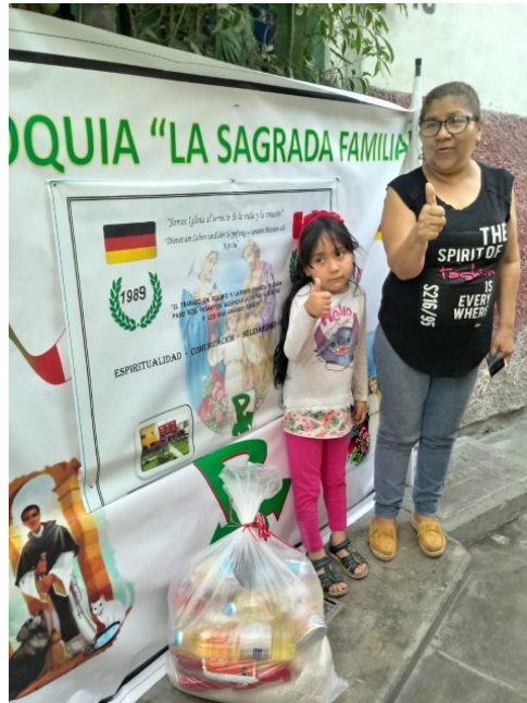
Oma mit Enkelin, die beide Eltern verloren hat