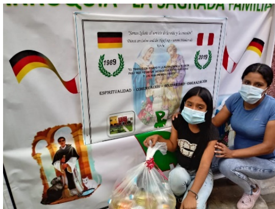
Tuberkulose Patientin mit Covid 19; drei ihrer Töchter sind ebenfalls daran erkrankt