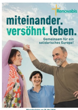
Pfingstkollekte am 20. Mai 2018