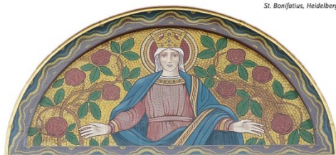
St. Bonifatius, Heidelberg

Im Mai feiert die Kirche die Gottesmutter Maria als Maienkönigin. Mitten im Frühling symbolisiert sie das blühende Leben, da sie Jesus das Leben geschenkt hat, durch den Gottes gute Schöpfung von der Vergänglichkeit des Todes erlöst wurde.